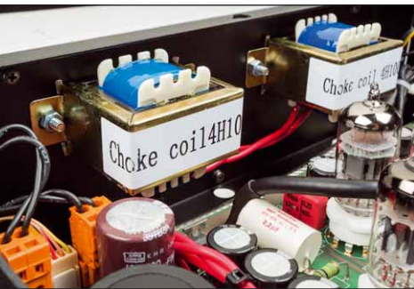
Zwei Drosseln sieben die Hochspannung für beide Kanäle getrennt – das ist mal Luxus