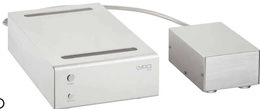
Der Netztrafo des Lyric PS 10 steckt in einem eigenen Gehäuse

Das Gerät ist zweiteilig konzipiert; im Stromversorgungsabteil steckt ein ordentlicher Netztransformator, der per einem Meter langem Kabel weit genug vom Ort des Kleinsignalgeschehens weg positioniert werden kann. Der Anschluss ans Verstärkerteil erfolgt per siebenpoligem Spezialverbinder, und das ergibt absolut Sinn: Der Netzeingang sitzt nämlich am Verstärker und dort wird das Ganze auch an- und aus-