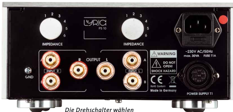
Die Drehschalter wählen die Abschlussimpedanz für MC-Abtaster in sechs Stufen