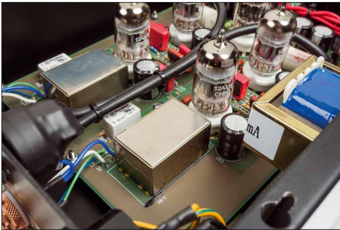
Die beiden rechteckigen Metallgehäuse schirmen die MC-Eingangübertrager ab