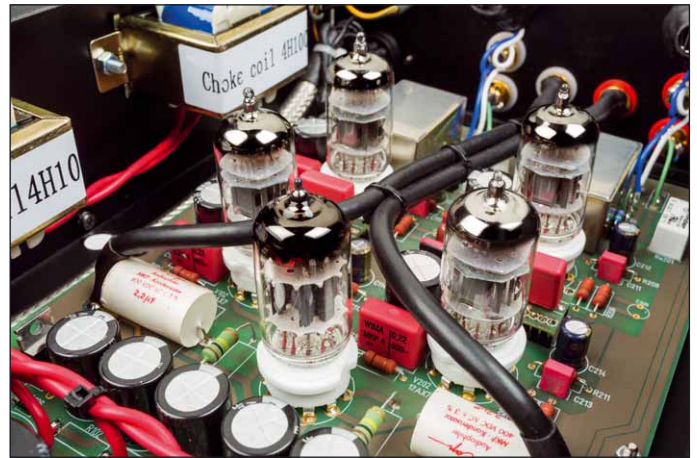
Fünf Röhren übernehmen die Verstärkung der Phosignale, alles Doppeltrioden gängiger Bauart

geschaltet. Will sagen: Am Netzteil gibt's nichts zu bedienen, so dass es zur Gänze hinter dem Schrank verschwinden darf.