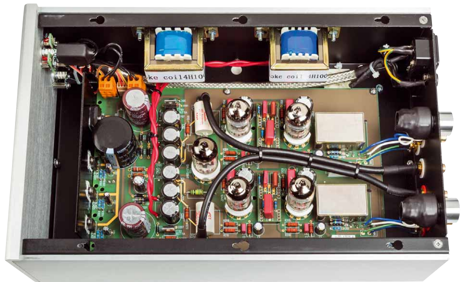
Schön aufgeräumter Aufbau, durchdachtes Platinenlayout – der PS 10 hat auch optisch einiges zu bieten

Der Amplitudenschrieb attestiert der PS10 eine gut funktionierende Entzerrung. Es gibt eine nicht weiter relevante Resonanz um 30 Kilohertz, ansonsten läuft der Frequenzgang bis 100 Kilohertz. Da Gerät liefert im MC-Betrieb einen Fremdspannungsabstand von ordentlichen 58,4 Dezibel(A), die Kanaltrennung liegt in der gleichen Größenordnung. Der Klirr bei 0,5 Millivolt am Eingang beträgt 0,22 Prozent – geht in Ordnung. Die Verstärkung im MC-Betrieb beträgt praxisgerechte 63,5 Dezibel, die Stromaufnahme konstante 20 Watt.